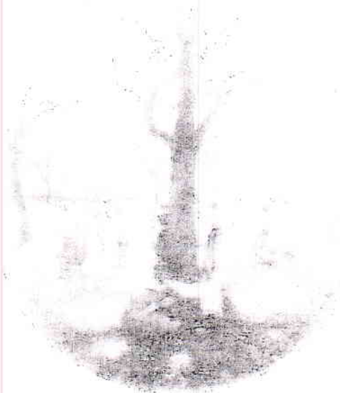
Giuseppe Pellizza da Volpedo, Idillio primaverile , 1896 – 1901, Collezione privata ( www.pellizza.it/index.php/idillio-primaverile/ )

« Natura . Immaginavi tu forse che il mondo fosse fatto per causa vostra? Ora sappi che nelle fatture, negli ordini e nelle operazioni mie, trattone pochissime, sempre ebbi ed ho l'intenzione a tutt'altro, che alla felicità degli uomini o all'infelicità. Quando io vi offendo in qualunque modo e con qual si sia mezzo, io non me n'avveggo, se non rarissime volte: come, ordinariamente, se io vi diletto o vi benefico, io non lo so; e non ho fatto, come credete voi, quelle tali cose, o non fo quelle tali azioni, per dilettarvi o giovarvi. E finalmente, se anche mi avvenisse di estinguere tutta la vostra specie, io non me ne avvedrei.»